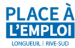
Place à l'emploi