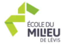
École du milieu de Lévis